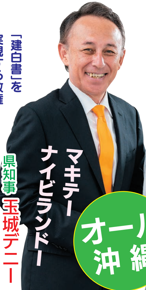
県知事 玉城 徳一

「建白書」を 実現する政権！ オール沖縄代表を 沖縄を愛する心・力をお貸しくください 全県のお知り合いに声をおかけください