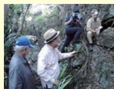
戦没者遺骨土砂問題を遺骨収集ボランティアの案内で調査