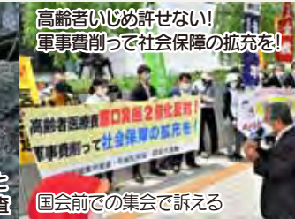
高齢者いじめ許せない！ 軍事費削って社会保障の拡充を！ 国会前での集会で訴える