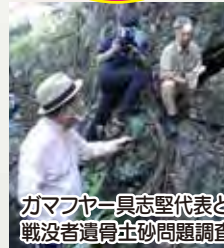
ガマフヤー具志堅代表と戦没者遺骨土砂問題調査

命どう宝・反戦平和・文化をこよなく愛する心 伝統文化振興と首里城再建は一体、芸能実演家支援を